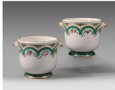
Sèvres Paire de seaux à bouteille en porcelaine tendre à décor polychrome de rubans verts et d'un entrelacs de guirlandes de fleurs. Marqués de la lettre-date « E » pour l'année 1758. Hauteur : 20 cm

BEAUSSANT LEFÈVRE & Associés 32, rue Drouot – 75009 PARIS +33(0)1 47 70 40 00 contact@beaussantlefevre.com www.beaussantlefevre.com