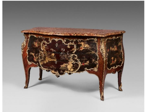
Commode galbée en placage de bois de violette ornée de panneaux en laque Estampillée L. Rochette. Époque Louis XV