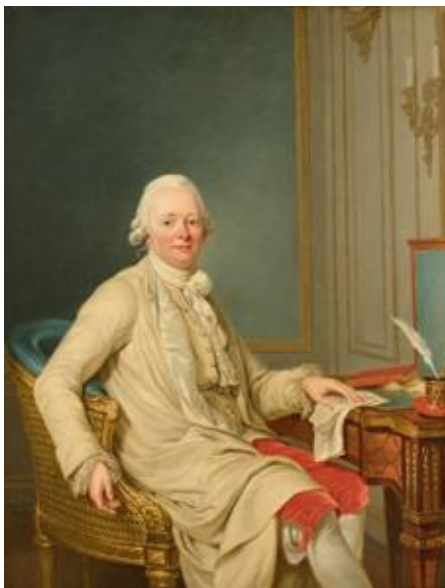
Adélaïde LABILLE-GUIARD (1749-1803) Portrait d'Étienne François de Choiseul-Beaupré Stainville, duc de Choiseul (1719-1785) Huile sur toile 72 x 56 cm